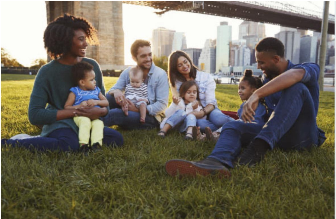
Conexiones de Padres!